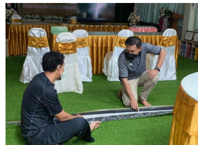
❖ วางแผนการสร้างและต่อเติมอาคารเพื่อความสะดวกและปลอดภัยในสถานศึกษา (โรงอาหาร)