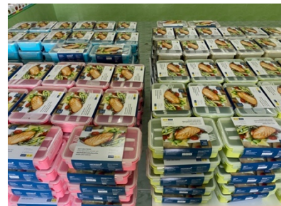
❖ แจกกล่องข้าวกลางวัน เพื่อป้องกันตามมาตรการการป้องกันการแพร่ระบาดของเชื้อ COVID-๑๙